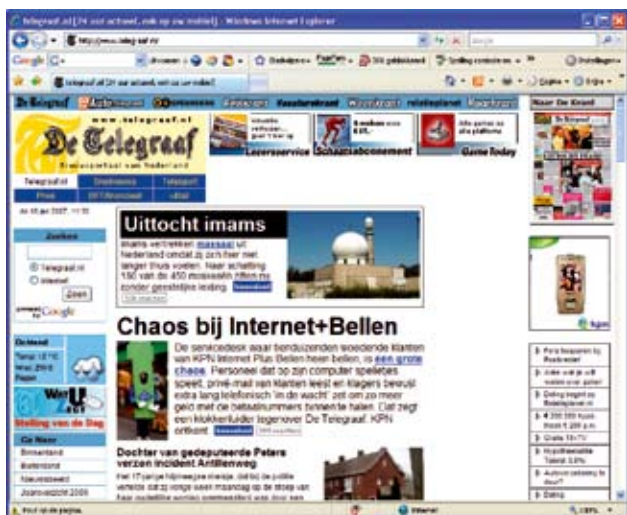
www.telegraaf.nl, januari 06

Moeheid (averechts, het is te veel) slaat om in "ik ben het zat" (aversie, het wordt me te veel). En dan zijn de rapen gaar, want op zo'n moment leveren de klassiek ingerichte marketingacties alleen maar een verlieslatende reactie op.