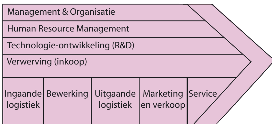
Figuur 3 Waardeketenmodel

De luchtvaartindustrie laat zien wat er gebeurt als nieuwkomers zoals EasyJet en Ryanair de markt betreden en de concurrentieverhoudingen op scherp stellen. Bij traditionele spelers als KLM en British Airways was innovatie in dienstverlening decenia lang ver te zoeken. Maar sinds kort kan men vanuit de luie stoel ook bij deze aanbieders online e-tickets kopen, zelf de zitplaats in het vliegtuig uitzoeken en zelf met behulp van een handterminal de bagage inchecken. Hoelang zou het nog du-