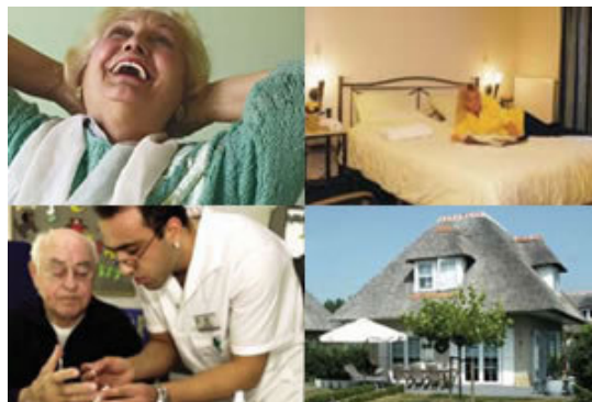
Vakanties met zorg in een bungalowpark.

Voor iedereen die een zorgvraag heeft op het gebied van verpleging en verzorging. In overleg wordt gekeken of de benodigde zorg geleverd kan worden en hoe u dit wenst. Voorafgaand aan uw verblijf zullen er afspraken worden gemaakt over wanneer u welke zorg zult ontvangen. U kunt hierbij denken aan wassen en aankleden, wondverzorging, medicijnen uitzetten en toedienen, injecteren, insuline spuiten, elastische kousen aantrekken, zwachtelen, controles, ogen druppelen etc..