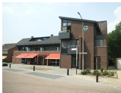
Appartementen met dagactiviteiten en zorg.

Er worden steeds meer woonvoorzieningen gerealiseerd met naast de woonfunctie, verschillende servicefuncties zoals zorg op maat, restaurant, maaltijdservice, boodschappenservice en dagbesteding. Zo staat in Hardenberg een woonvoorziening met daarin op de begane grond een dagactiviteiten-centrum. Op de eerste en tweede verdieping zijn in totaal negen appartementen gerealiseerd. Het project is uitgevoerd in samenwerking met Stichting Nieuw Baalderborg uit Hardenberg. De appartementen zijn bestemd voor zelfstandige bewoning onder begeleiding van Stichting Nieuw Baalderborg.