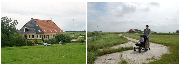
Recreatieboerderij en Zorg boerderij hotel Slachtehiem.

Zorgtoerisme is een groeimarkt. Zorgondernemers kunnen zich dan ook richten op zorgvragers die graag op een “normale” manier, samen met familie of vrienden, een weekendje weg willen of wat langer op vakantie willen gaan. Belangrijk is dat de huisvesting, omgeving en sfeer vooral een vakantiegevoel uitstralen en niet de sfeer van een zorginstelling. Er zijn onvoldoende accommodaties in Noord-Nederland die passen bij de wensen van de zorgvrager. Verhoogde toiletten, liften, beugels aan de muur van het toilet, geen drempels, aangepaste douches en brede deuropeningen staan allemaal hoog op de wensenlijst, maar zijn in Noord-Nederland in de recreatiesector in onvoldoende mate te vinden. En als de accommodatie aangeeft speciale voorzieningen voor gehandicapten te hebben, komt het voor dat er een zandpad naar de voordeur ligt of een aangepast toilet dat uitsluitend via de trap bereikbaar is.