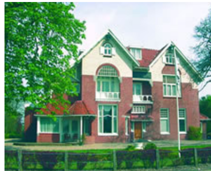
Een Thomas huis in Friesland.