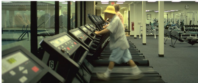
Actieve senioren in Seniorenstad.

De voorzieningen in Seniorenstad worden in een combinatie van vrijwillige en professionele inzet beheerd. De voorzieningen zijn opgeleverd voordat er woningen staan. Een greep uit het aanbod: zwembad, tennisbaan, fitness, zaalruimte voor theater en verenigingen, bowles, café, restaurant en dienstencentrum.