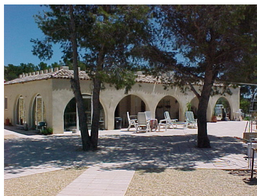
Vakantie met zorg in Spanje.

Op de website www.zorgvakantieplan.nl staat het volgende te lezen: Aan de Costa Blanca heeft het Zorg Vakantie Plan dit appartementencomplex voor u geselecteerd. Alle appartementen zijn uitermate geschikt voor rolstoelen. De eigenares zit in een rolstoel en heeft dit complex met haar man ontworpen. Het geheel is uitgevoerd met hoogwaardige materialen.