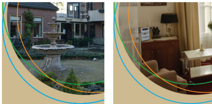
Impressie van Zorghotel De Gouden Leeuw in Gelderland.

Sommige zorghotels zijn “normale” hotels die zich naast normale gasten ook richten op gasten met een “zorgvraag”. Een voorbeeld hiervan is het viersterren Zorghotel De Palatijn te Alkmaar dat zich zowel richt op normale gasten als op zorggasten.