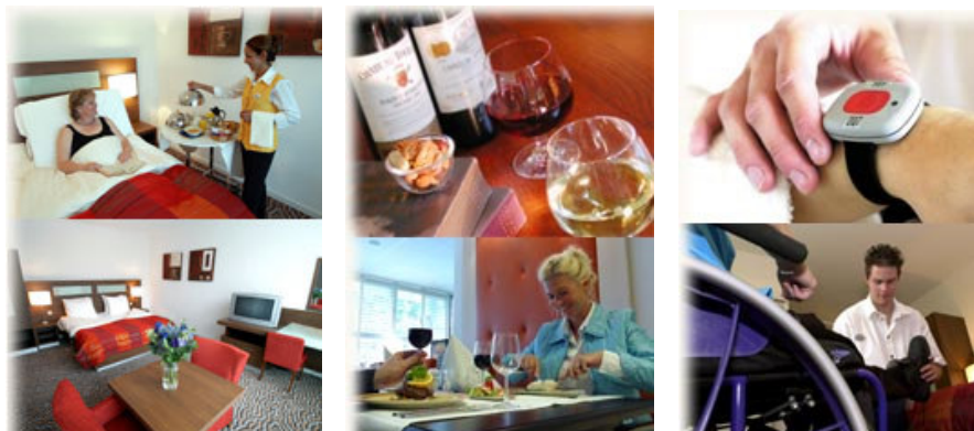
Impressie van Zorghotel De Palatijn, Alkmaar.

Sommige zorghotels zijn “normale” hotels die zich naast normale gasten ook richten op gasten met een “zorgvraag”. Een voorbeeld hiervan is het viersterren Zorghotel De Palatijn te Alkmaar dat zich zowel richt op normale gasten als op zorggasten.