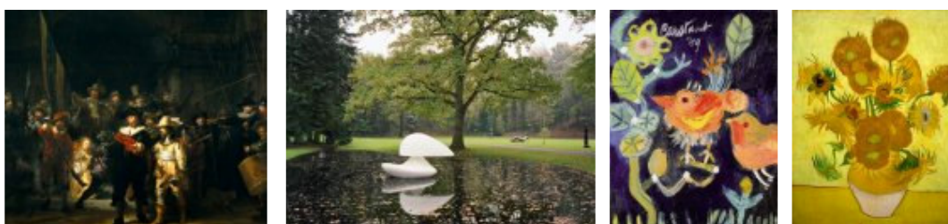
Museum plus bus voor senioren en bewoners verzorgingshuizen.

De Museum Plus Bus is een initiatief van zeven musea. Het werkt zo: groepen senioren uit verzorgingshuizen of met thuiszorg gaan naar twee musea op één dag. Of naar het Kröller-Müller Museum solo. Ze worden gastvrij ontvangen, krijgen koffie en een rondleiding en genieten naar hartelust. De bus haalt op, brengt, brengt terug. Maximaal 45 personen, rollators mee. Gratis! Dankzij de genereuze steun van de BankGiro Loterij. De bus is er speciaal voor groepen. Die kunnen worden aangemeld via het inschrijfformulier op een website ( www.museumplusbus.nl ). De Museum Plus Bus is een luxe touringcar die van alle gemakken is voorzien. Deelnemende zorginstellingen zorgen voor de begeleiding. In de bus is koffie, thee en water verkrijgbaar. Rolstoelen en rollators zijn in de bus te vervoeren. Meegaan is gratis. De Museum Plus Bus wil in 2008 tenminste 10.000 senioren op deze wijze een interessante museumdag bezorgen.