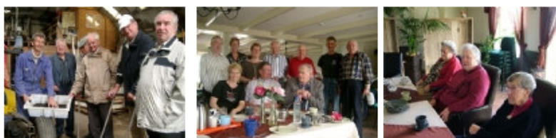
Senioren op dagrecreatie bij recreatieboerderij Slachtehiem

Recreatieboerderij Slachtehiem speelt in op de groeiende groep eenzame senioren. Dit leest u op de website van www.slachtehiem.nl : Het ontmoeten van andere mensen, samen eens een activiteit doen, maar ook even lekker rustig zitten met een glaasje fris of een borreltje. Dat is dagrecreatie. Slachtehiem biedt samen met de thuiszorg organisatie Zuid West Friesland dagrecreatie aan op onze unieke locatie! Onze recreatieboerderij is gelegen in een landelijk gebied aan de historische waterkering de Slachte.