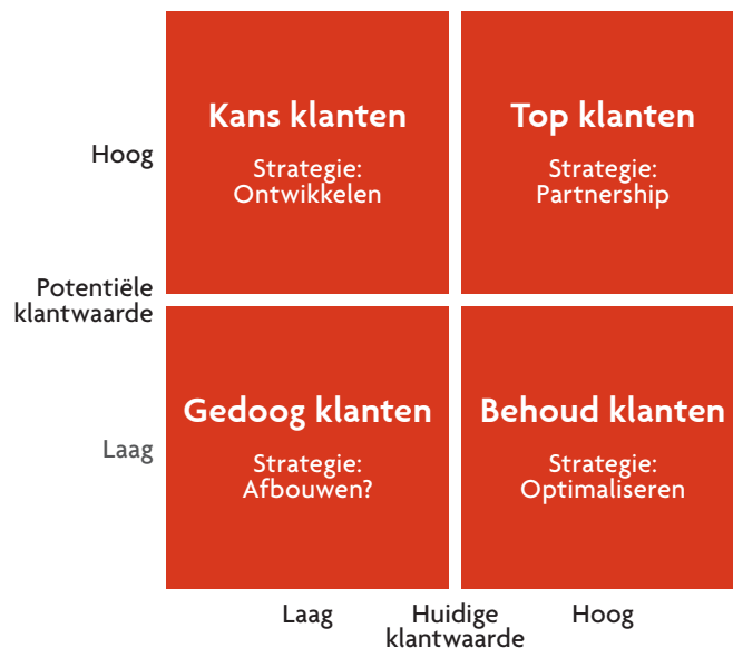
Figuur 1. Klantwaardematrix (CRM in de praktijk)

Klanten verschillen van waarde voor de organisatie. Er zijn grote en kleine klanten en sommige klanten zijn winstgevend terwijl andere klanten geld kosten. Voor klantsegmentatie op basis van klantwaarde zijn meerdere oplossingen denkbaar. De bekendste segmentatiemethode op dit gebied is ongetwijfeld de 'Customer Marketing Methode' van Jay Curry, ook wel klantenpiramide genoemd. Uit onderzoek van Jay Curry onder 400 bedrijven in business-to-business markten blijkt bijvoorbeeld dat 5 procent van de klanten zorgt voor 75 procent van de winst en dat 80 procent van de klanten meer kosten dan ze opbrengen. Invoering van de klantenpiramide resulteert vaak in de bekende indeling in A-, B-, C- en D-klanten. Een andere veel gebruikte segmentatiemethode bestaat uit het indelen van klanten in klantgroepen op basis van de huidige en potentiële klantwaarde (zie figuur 1). De hiermee verkregen klantwaardematrix biedt goede aanknopingspunten voor gerichte marketingacties. De moeilijkheid van deze methode is het op een juiste manier toerekenen van kosten en opbrengsten aan individuele klanten. Voor het gemak gebruiken bedrijven daarom vaak de omzet per klant of het aantal afgenomen producten per klant als graadmeter voor de klantwaarde.