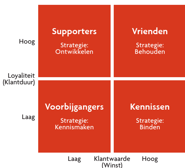
Figuur 2. Klantloyaliteitsmatrix (CRM in de praktijk)

Alle bovenstaande segmentatiemethoden kunnen in meer of mindere mate gecombineerd worden. Zo kan men ook klantgroepen samenstellen op basis van zowel de klantwaarde van klanten als de wensen en behoeften van klanten. In figuur 3 ziet u een fictief voorbeeld van een gemixte benadering. Hierbij worden klanten van een financiële instelling ingedeeld op basis van hun totaal belegd vermogen (klantwaarde) en hun behoefte aan ondersteuning bij het beleggen van hun vermogen (klantbehoefte). Het resultaat is negen klantgroepen.